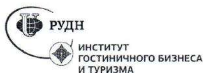
Рисунок 3 – Логотип ИГБ и Т РУДН

При составлении списка использованных источников необходимо соблюдать определенную последовательность в перечислении