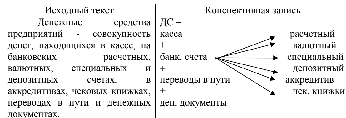
Рис. 1. Пример конспективной записи текста

Конспектирование лекции – это свертывание текста, в процессе которого не просто отбрасывается мало важная информация, а свертывается все то, что позволяет через определенный промежуток времени развернуть конспектируемый текст без существенной потери информации.