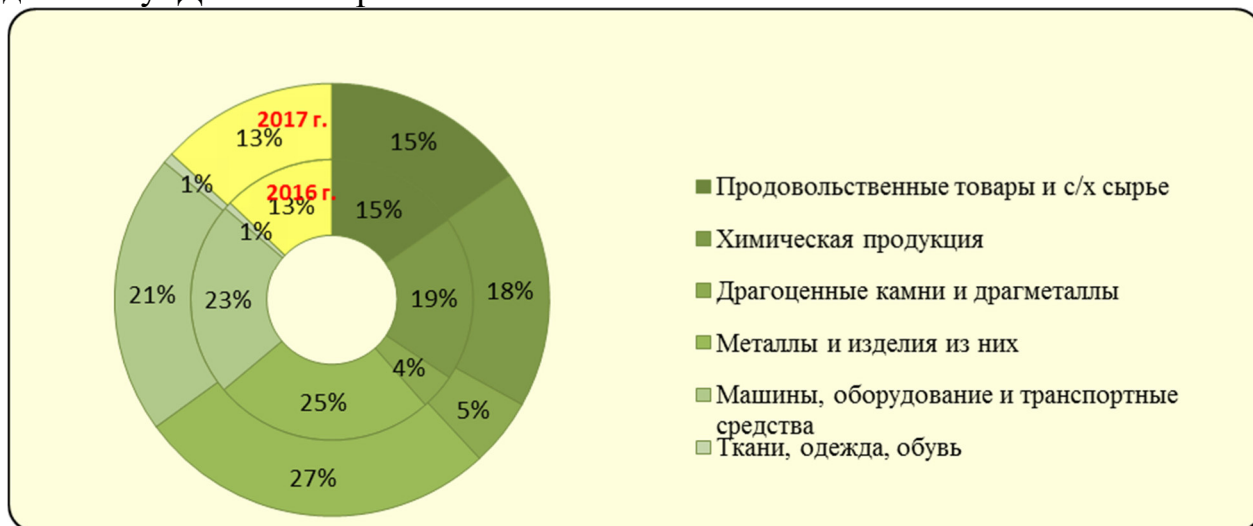
Рис. 2 Товарная структура несырьевого неэнергетического экспорта России в 2016 – 2017 годах (по стоимости товаров)

Какой показатель экономической безопасности можно рассчитать по данным, приведенным на диаграмме. Охарактеризуйте показатель и его динамику. Данные на рис. 2.