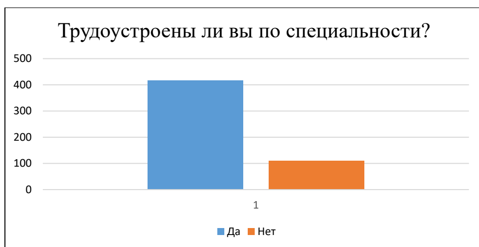
Рисунок 2. Информация о трудоустройстве по специальности

На вопрос «Трудоустроены ли вы по специальности?» 417 выпускников 2023 года выпуска ответили, что их нынешняя профессия полностью или частично соответствует специальности, которую они приобрели в Университете, что говорит о высоком качестве образования и положительной тенденции построения карьеры по полученной специальности.