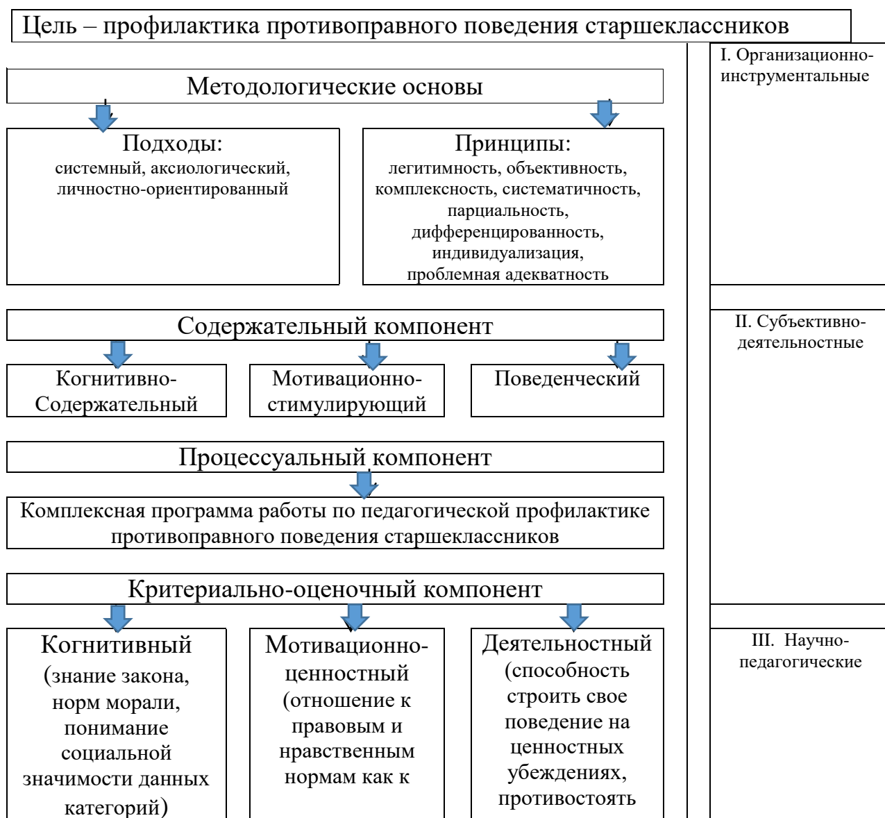
Рисунок 1. Модель «Профилактика противоправного поведения старшеклассников в общеобразовательных организациях».

Таким образом, мы определили и описали элементы модели.