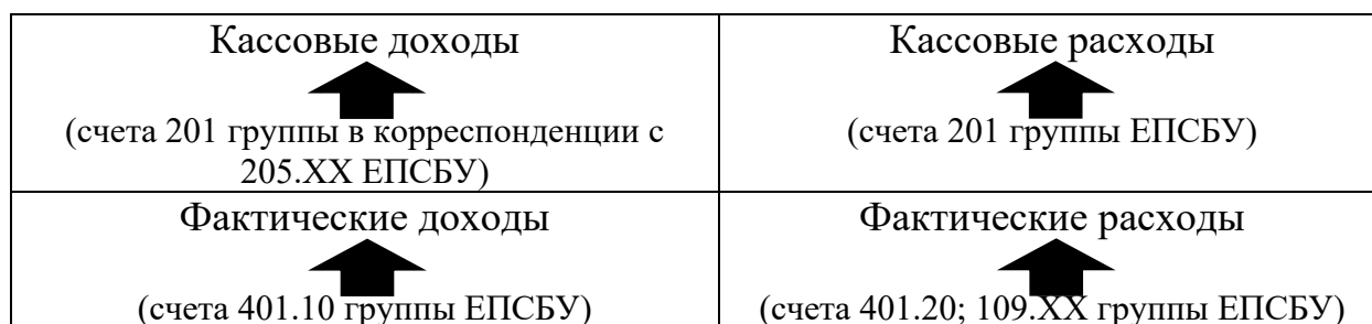
Рис. 2. Схема регистров управленческого учета в АУВО.

2). Поскольку система строится на основе данных бухгалтерского учета, то обеспечивается достоверность модели управленческого учета.