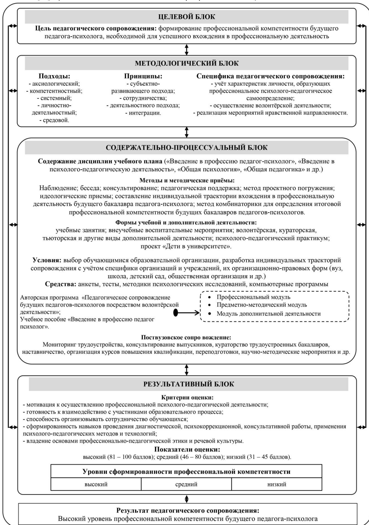
Рисунок 1. Модель педагогического сопровождения процесса вхождения будущих педагогов-психологов в профессиональную деятельность